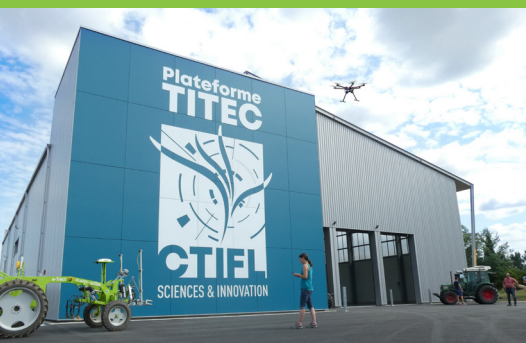
Une plateforme indoor/outdoor en automatisation et robotisation agricole