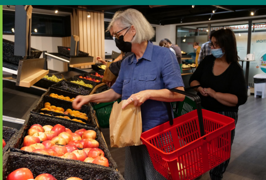
Une Zone Expérimentale Point de Vente

94 Ouvriers 82 Techniciens 144 Ingénieurs