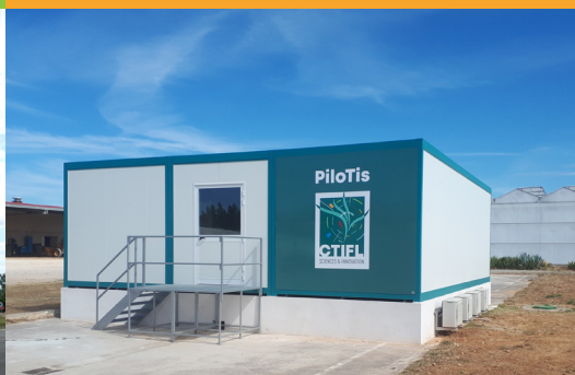
Une plateforme Technique de l'Insecte Stérile