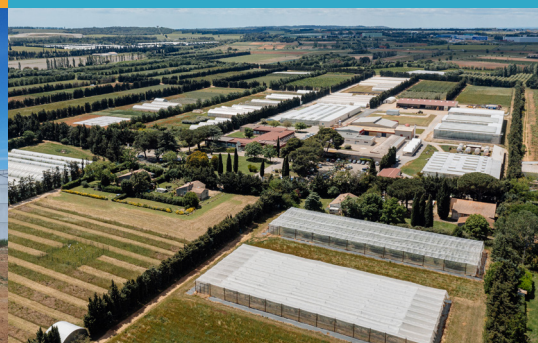
190 ha de surfaces d'expérimentation