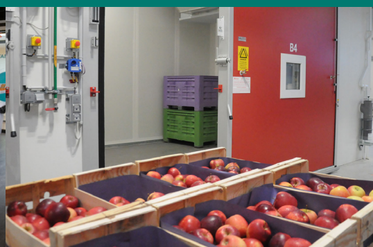
Une plateforme post-récolte